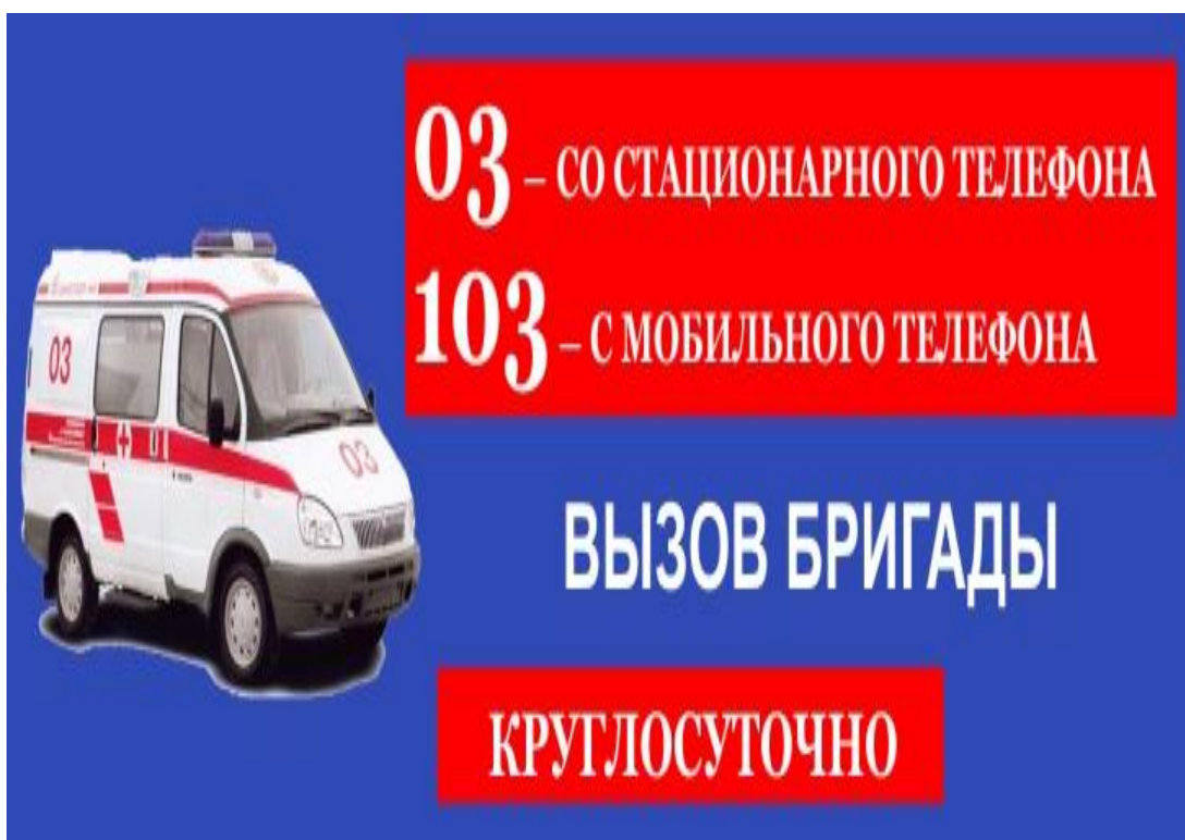
Слайд № 19