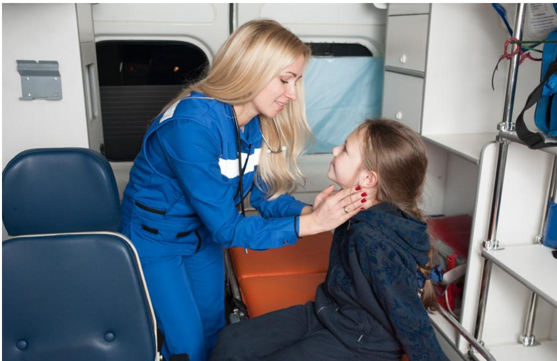
Слайд № 18