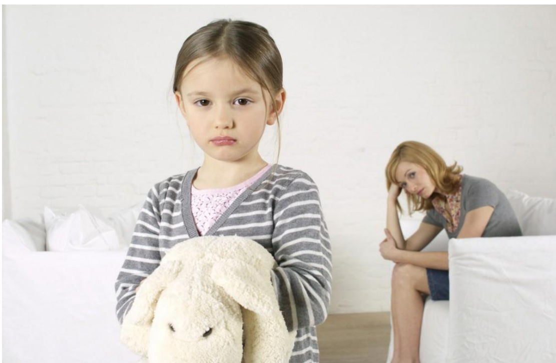
Слайд № 15