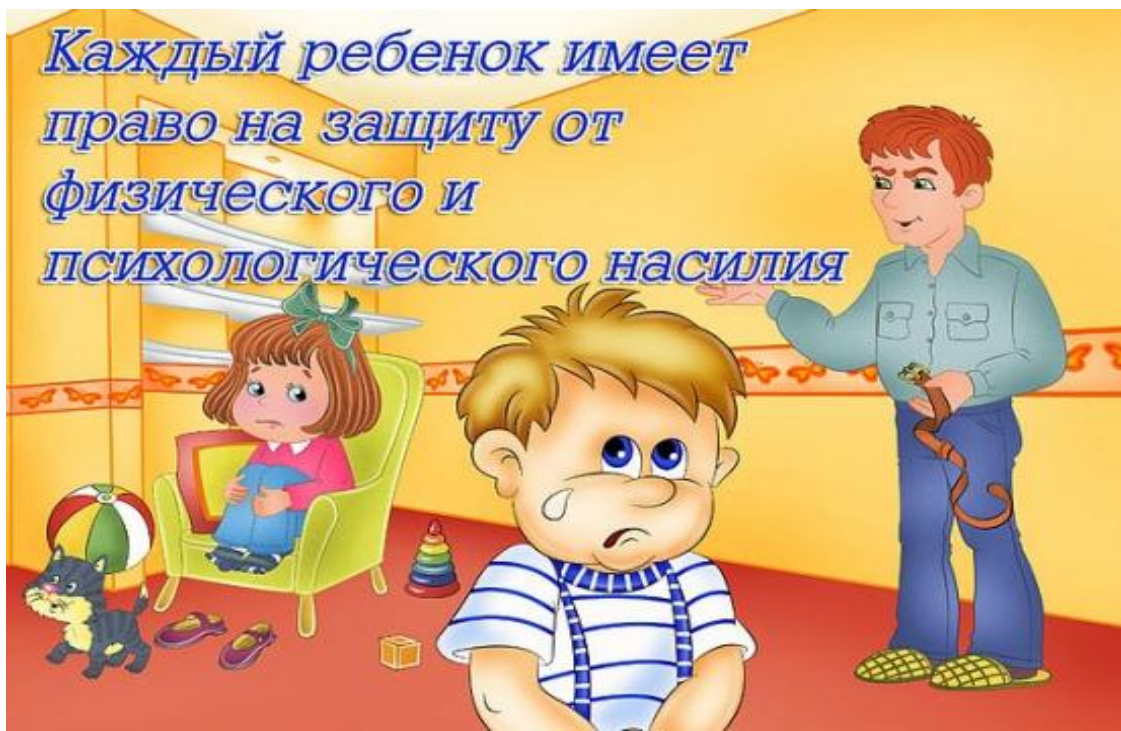
Слайд № 10