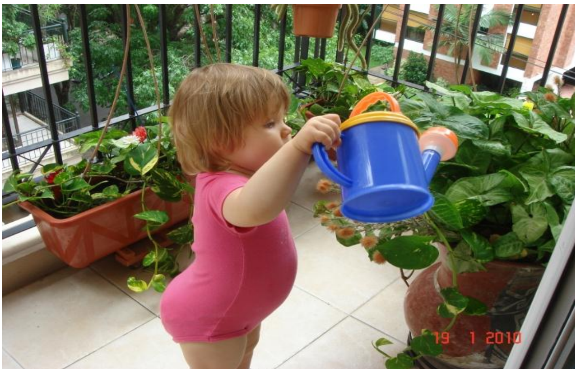
Слайд № 14